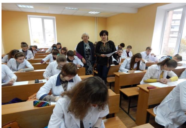
Всеукраїнська студентська олімпіада з української мови