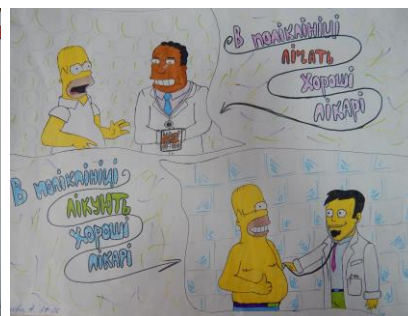
Виставка стіннівок до Дня української мови та писемності та «Як парость виноградної лози»

❖ Проведені екскурсії та тематичне заняття «Мовна мозаїка» в етнографічному музеї НФаУ (з демонструванням предметів народних промислів);