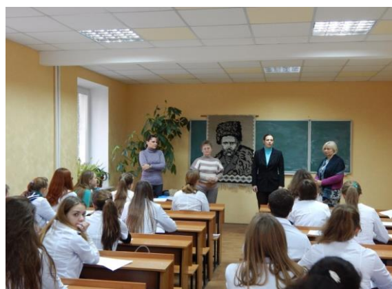
Університетський тур мовно-літературного конкурсу ім. Т. Г. Шевченка та П. Яцика