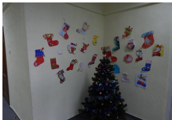
Арт-акції до «Подаруй людям писанку» і «Привітання від святого Миколая»